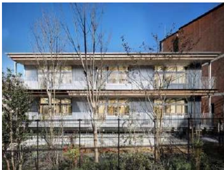
昭和学院小学校ウエスト館 株式会社 日建設計 | Nikken Wood Lab (東京都) 学校法人昭和学院 (千葉県) 建築・空間分野

軒の高さを抑えつつ、国産杉CLTを構造と内装材として使いながら、交流を生む空間づくりに配慮した。生徒がその表情や質感を感じられる設計の工夫があり、ダイナミックかつ洗練された学びの空間を実現させている。