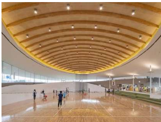
シェルターインクルーシブプレイス コパル（山形市南部児童遊戯施設） 山形市（山形県）大西麻貴＋百田有希／o+h （東京都）株式会社シェルター（山形県）株 式会社高木（山形県）合同会社ヴォーチェ （山形県）特定非営利活動法人 生涯スポーツ 振興会（アプルス）（山形県） 建築・空間分野

雄大な木造ドームや木質感の溢れる回遊型 の大空間で、子どもの年齢、性別問わず思 いのままに遊べ、多様でチャレンジな遊 びを誘発する。雨天の際や冬季の外遊びの 制限といった課題を解決するための屋内型 施設は地域にとって貴重であり、その外観も 周辺風景に溶け込む美しさを併せ持っている。