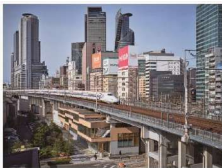
笹島高架下オフィス 名古屋ステーション開発株式会社（愛知県） 有限会社マル・アーキテクチャ（東京都） 帝人株式会社（大阪府） シーエヌ建設株式会社（愛知県） 坂田涼太郎構造設計事務所（東京都） 建築・空間分野

高架下という制約のある空間に快適に働くことができ、集いなくなる木造オフィスの提案に取り組んだ社会提案性のある作品である。駅近という立地は、街に開く木造建築のシンボリックな存在にもなる。