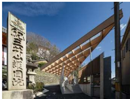
紀三井寺ケーブル山麓駅 清水建設株式会社 (東京都) 紀三井寺 (和歌山県) 建築・空間分野

小さな木の家が並ぶように構成された、周辺環境と融合した穏やかな建築が素晴らしい。地域の技術で建てられた園舎は、園庭の活用や農との接点を重視した活動などの取組とともに親和性がある。