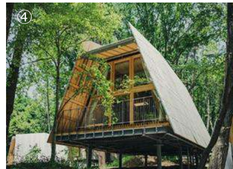
①農林水産大臣賞「MOKUWELL HOUSE」（MEC Industry株式会社）、②経済産業大臣賞「ワーカーのウェルビーイングな働き方をサポートするビッグテーブル『シルタ』」（株式会社イトーキ）、③国土交通大臣賞「HULIC & New GINZA 8」（株式会社竹中工務店ほか）、④環境大臣賞「SANU 2nd Home」（株式会社Sanuほか）。