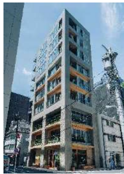
KITOKI 平和不動産株式会社 (東京都) 株式会社 A D X (福島県) 建築・空間分野

軒の高さを抑えつつ、国産杉CLTを構造と内装材として使いながら、交流を生む空間づくりに配慮した。生徒がその表情や質感を感じられる設計の工夫があり、ダイナミックかつ洗練された学びの空間を実現させている。