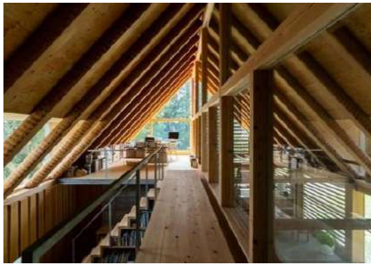
パウマイスターの家 株式会社平成建設（静岡県） 網野禎昭（静岡県） 株式会社宮田構造設計事務所（東京都） 二宮木材株式会社（栃木県） 株式会社長谷川萬治商店（東京都） 建築・空間分野

縦ログと重ね梁を用いた、木に関わる様々な活動や情報の拠点となる施設であり、木産地である同町のサプライチェーン構築に取り組んだロールモデルとして評価できる。空間は機能別にうまくまとまっており、フローリングや家具には樹種名の説明を設けるなど来訪者に対する木育機能も持っている。