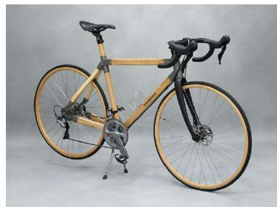
木製自転車スポーツタイプ TR-S型 E-Thruタイプ カネモク工業株式会社（東京都） 木製品分野

自然の中に身をゆだね、天空で木に囲まれ ながら心身の健康やウェルビーイングを実感 できる感性に訴える非常に美しく、豊かな空 間である。古来から座禅の空間は木が使わ れ親しまれてきたが、新たな解釈と技術、デ ザインでその価値を見事に再発見させる建 築である。豊富なプログラムや宿泊機能など、 多様な参加者ニーズに応えている。