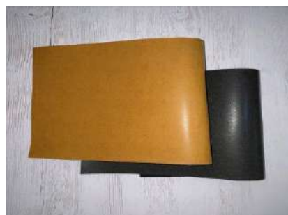
Wood Leather サンプロ株式会社（京都府） 木製品分野

製材過程で生まれる杉皮を煮沸してインクを製造、木製ペンとのセットで販売したユニークな作品で、書き味もよい。書くという行為を通じ、暮らしの中でごく普通に木の付加価値利用をもたらしてくれる。