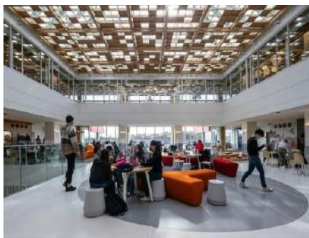
Canadian Academy 株式会社竹中工務店（大阪府） 学校法人カネディアン・アカデミー（兵庫県） Karen Glandrup Architects（兵庫県） 株式会社小林木工（兵庫県） 建築・空間分野

高架下という制約のある空間に快適に働くことができ、集いなくなる木造オフィスの提案に取り組んだ社会提案性のある作品である。駅近という立地は、街に開く木造建築のシンボリックな存在にもなる。