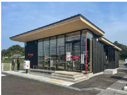
みんなで作るみんなの郵便局「丸山郵便局」 日本郵政株式会社一級建築士事務所 (東京都) 日本郵便株式会社 (東京都) 住友林業株式会社 (東京都) 南房総市教育委員会 (千葉県) 株式会社早川 (千葉県) 建築・空間分野

地域住民とともに参加型のプログラムを採用しながら、木造化を実現したアプローチは自分事化の好例である。郵便局という地域密着かつ店舗数の多い社会インフラがこうした取組を推進する意味は大きい。