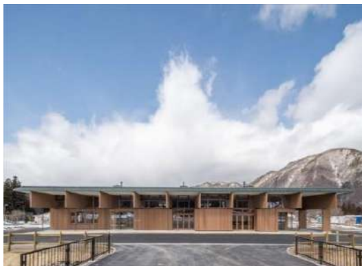
みなみあいづ森と木の情報・活動 ステーション「きとね」 南会津町（福島県） 建築・空間分野

縦ログと重ね梁を用いた、木に関わる様々な活動や情報の拠点となる施設であり、木産地である同町のサプライチェーン構築に取り組んだロールモデルとして評価できる。空間は機能別にうまくまとまっており、フローリングや家具には樹種名の説明を設けるなど来訪者に対する木育機能も持っている。