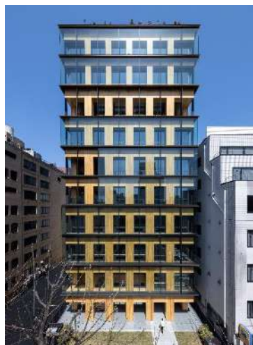
Port Plus 大林組横浜研修所 株式会社大林組（東京都） 建築・空間分野

木造の構造躯体を外からでも見える構造 とすることで、都市や来訪者に向けて木 造建築物のインパクトを訴求して木の時 代の到来を発信する役割を担うとともに、 利用者のウェルビーイングをもたらし空 間提案や効果分析などを行なった先端 的な取組である。空間の用途ごとに五感 や感性を刺激する樹種やデザインの工夫 が施されているため、今後の展開にも期 待が持てる。