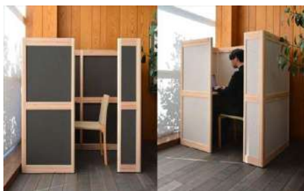
Grove 株式会社ワイス・ワイス（東京都） 株式会社マルホン（静岡県） 木製品分野

木材を使用したエシカル製品の開発に寄与する独創性の高い技術提案であり、その質感が驚くほど革に近い。皮革製品と比較した場合の木材由来の特性も雑貨や日用品での活用を幅を広げるだろう。