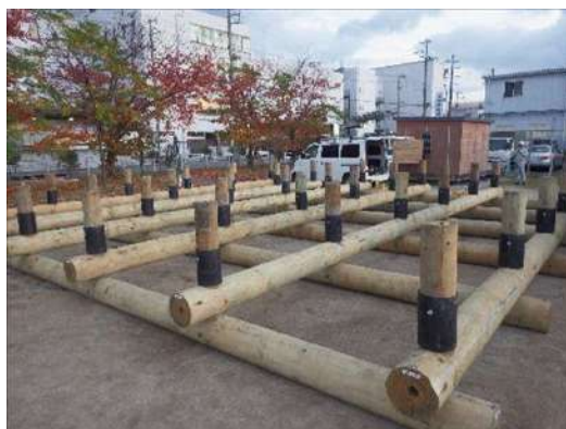
木製浮き基礎工法 越井木材工業株式会社（大阪府） 技術・建材分野

雄大な木造ドームや木質感の溢れる回遊型 の大空間で、子どもの年齢、性別問わず思 いのままに遊べ、多様でチャレンジな遊 びを誘発する。雨天の際や冬季の外遊びの 制限といった課題を解決するための屋内型 施設は地域にとって貴重であり、その外観も 周辺風景に溶け込む美しさを併せ持っている。