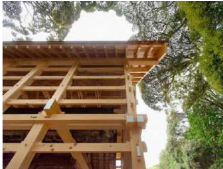
星野神社 覆殿新築及び本殿改修・復元 株式会社 望月工務店/望月建築設計室 (愛知県) 建築・空間分野

地域住民とともに参加型のプログラムを採用しながら、木造化を実現したアプローチは自分事化の好例である。郵便局という地域密着かつ店舗数の多い社会インフラがこうした取組を推進する意味は大きい。