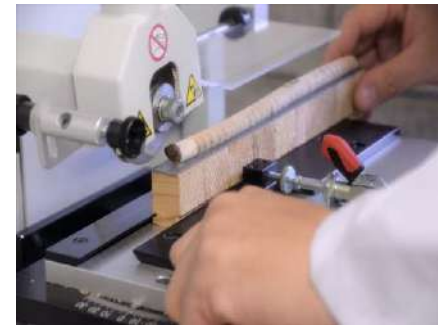
木材の未来を拓くゲノム診断技術 住友林業株式会社 (茨城県) 北海道立総合研究機構 森林研究本部 林業試験場 (北海道) 北海道立総合研究機構 森林研究本部 林産試験場 (北海道) 調査・研究分野

伝統技術の継承と地域材利用による環境保全、伝統や文化を伝達の三位一体の取組として、百年単位での視野に感銘を受けた。学生や若手大工の育成にもつながる社会的にも重要な取組である。