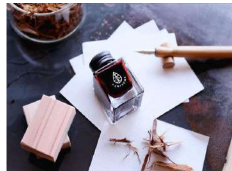
ひみり山杉からできたインク/つけペン セット 岸田木材株式会社（富山県） 株式会社竹田事務機（京都府） 株式会社田中直染料店（京都府） 株式会社岸田（富山県） 木製品分野

アトリウムを象徴する木格子パネルはカフェラウンジやステージを明るくして、交流や活動を促す場づくりにつながった。意匠性を重視した木の使い方はインターナショナルスクールに日本らしさを表現することに成功している。