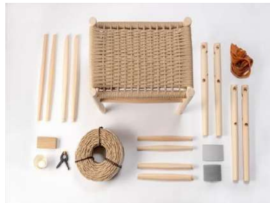
Do kit yourself 家具キット 株式会社維鶴木工（奈良県） 木製品分野

基礎部分は、建築物が完成した後では意識さ れることは少ないが、こうした分野にも木材を 積極的に活用し、解体・廃棄・再利用までを含 めたライフサイクルコストにおける優位性と環 境配慮を施主や事業者が意識を向ける契機と なる点は高く評価できる。防腐処理を施した解 体部材は再利用も容易で、杭や擁壁などの土 木分野での再利用も可能である点も有用性が 高い。