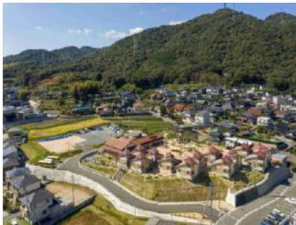
小郡幼稚園 無有建築工房 (大阪府) 学校法人片山学園 (山口県) 株式会社安成工務店 (山口県) 岡崎木材工業株式会社 (山口県) 建築・空間分野

築45年超の建物をリノベーションし、テーブル天板や個室ブース等に意図的に木材を多様し、ワークスペースの快適性や生産性向上と木材の関係性についての気づきをもたらす。未利用材を積極利用した内装や装飾も質が高い。