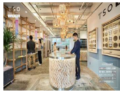
TOKYOシェアオフィス墨田 株式会社 船場 (東京都) 凸版印刷株式会社 (東京都) 株式会社 SALT (福岡県) 株式会社森未来 (東京都) 建築・空間分野

SRC造構造体に木造建築物を入れ子状に組み込んだ独自性ある作品である。実質的に低層木造建築と見なされるため、木造住宅のノウハウや特徴を活かしてフロアごとに様々な空間デザインを見せることに成功している。