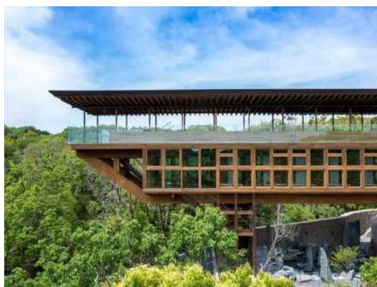
禅坊 靖寧 株式会社坂茂建築設計（東京都）株 式会社パソナグループ（東京都）前田建 設工業株式会社（東京都）ナイス株 式会社（神奈川県） 建築・空間分野

木造の構造躯体を外からでも見える構造 とすることで、都市や来訪者に向けて木 造建築物のインパクトを訴求して木の時 代の到来を発信する役割を担うとともに、 利用者のウェルビーイングをもたらし空 間提案や効果分析などを行なった先端 的な取組である。空間の用途ごとに五感 や感性を刺激する樹種やデザインの工夫 が施されているため、今後の展開にも期 待が持てる。