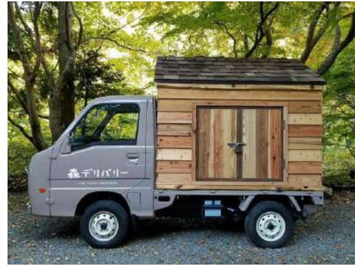
森への入り口をお届けします ～森デリバリー～ 株式会社東京チェーンソーズ（東京都） コミュニケーション分野

大径木の利用に向けて、製材、建築、施主が連携して取り組むことで課題解決と地域の様々な価値創出につながった意欲的な作品である。大径木は大きなまま使うことで歩留まりを向上させ山側の利益につなげるとともに、仮に解体された後でも再利用できるなど、経済性、社会性とダイナミックな空間づくりを同時に満たしている。