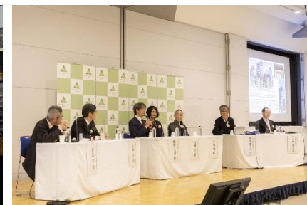
▲エコプロ2022での展示、セミナー