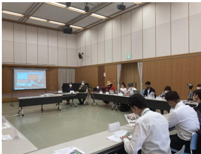
▲「URASHIMA VILLAGE」見学会では三豊市の 取り組みについて、県、市、事業担当者との意見 交換会を実施