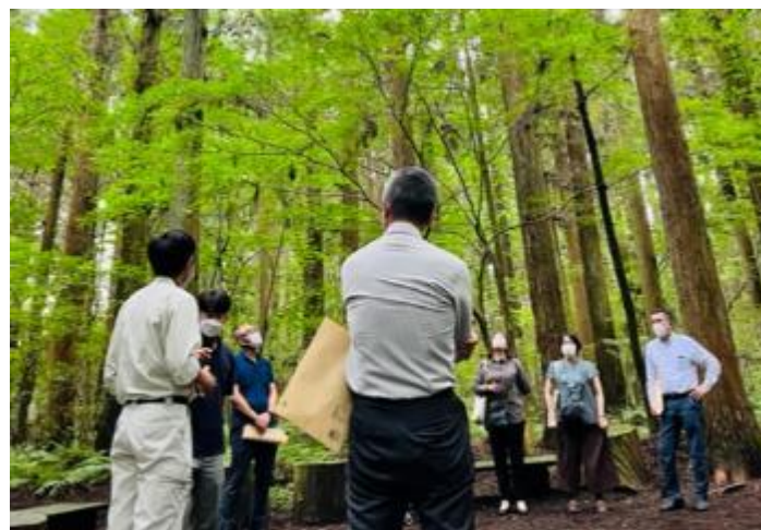
▲2022年8月 マッチングイベント東北開催 小岩井農牧株式会社 百年の森