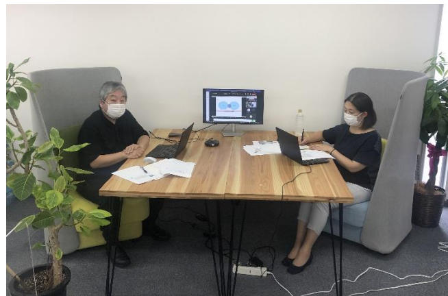
▲審査委員セミナーをオンライン配信