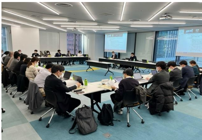
▲2023年3月 第6回マッチング分科会 三菱地所株式会社社会議室