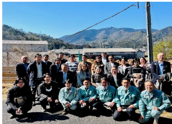
▲2023年2月 マッチングイベント中国開催 中本造林株式会社