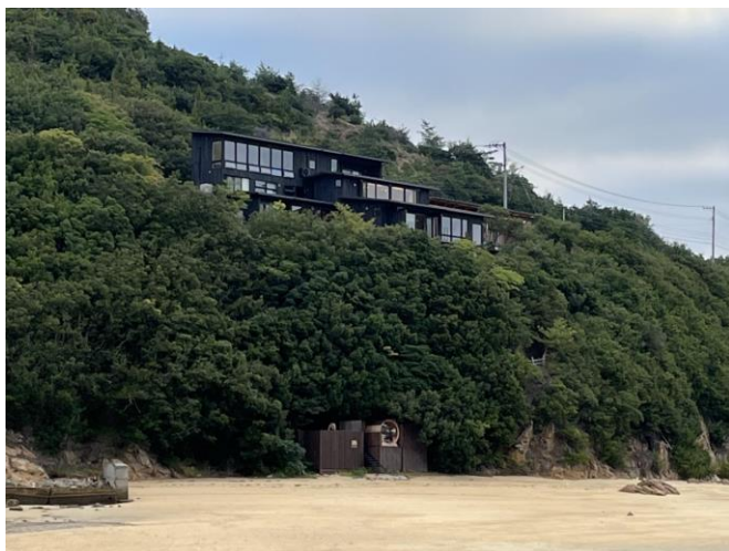
▲ウッドデザイン賞2021農林水産大臣賞受賞作品 「URASHIMA VILLAGE」(香川県三豊市) 見学会