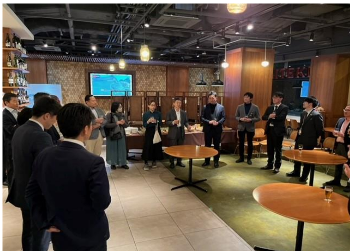
▲2023年3月 マッチングイベント東京 大手町ビル カイテキカフェ