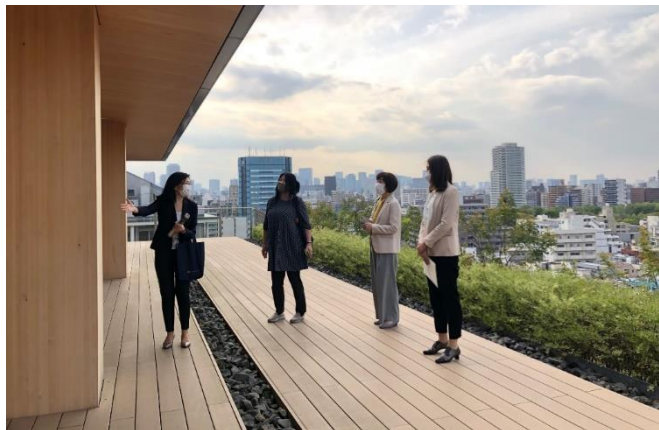
▲ウッドデザイン賞2020林野庁長官賞受賞作品 「FLATS WOODS木場」 見学会