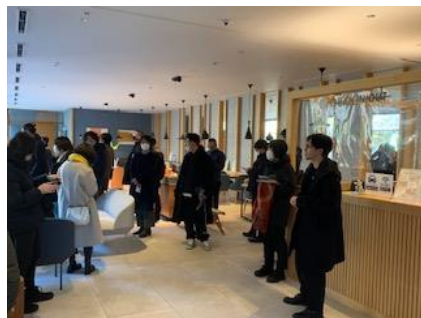
▲「ウッドデザイン」地域セミナー2023 in NAGANO ～観光・交流・宿泊施設の魅力を高めるウッド・チェンジ～ (1/18～19)