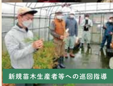
新規苗木生産者等への巡回指導