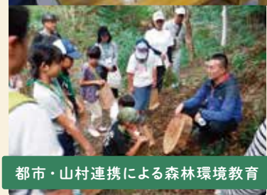
都市・山村連携による森林環境教育