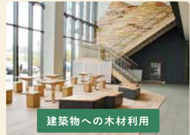
建築物への木材利用