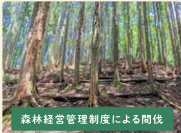
森林経営管理制度による間伐