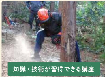
知識・技術が習得できる講座