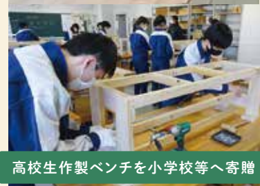
高校生作製ベンチを小学校等へ寄贈