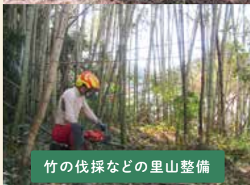
竹の伐採などの里山整備