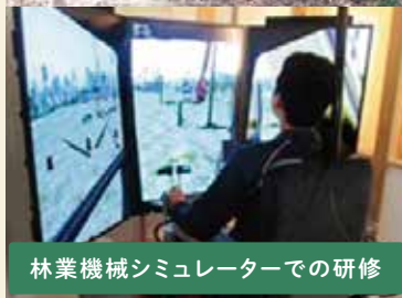
林業機械シミュレーターでの研修