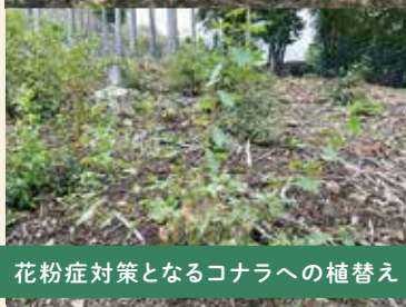
花粉症対策となるコナラへの植替え