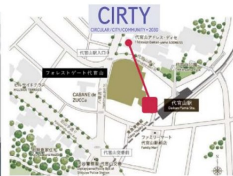
東京都渋谷区代官山町20-12 TENOHA代官山 東急東横線・代官山駅より徒歩1分 Forestgate Daikanyama (フォレストゲート代官山) 内